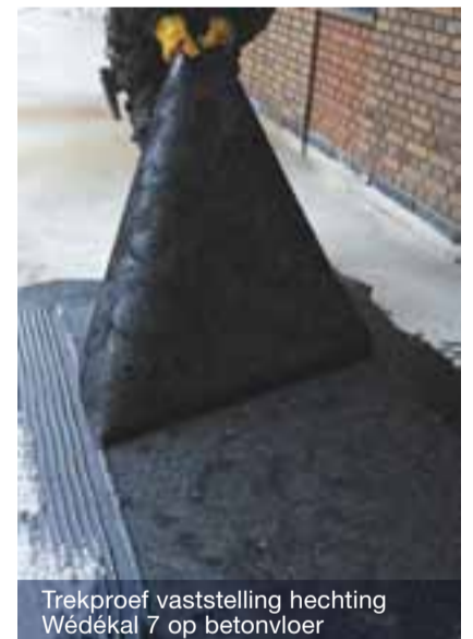
Trekproef vaststelling hechting Wédékal 7 op betonvloer

Na gereedkomen van het metselwerk aan de woninggevels is de Wédéflex Maaiveldbaan gecontroleerd en hersteld waar beschadigingen aanwezig waren. De wortelwerende dakbaan Wédéflex D4 No Roots is hierna volledig verkleefd op de Wédéflex Maaiveldbaan, volgens de brandmethode en conform de procedure voor intensieve daktuinen 10 dagen onder water gezet voor overdracht naar de hovenier.