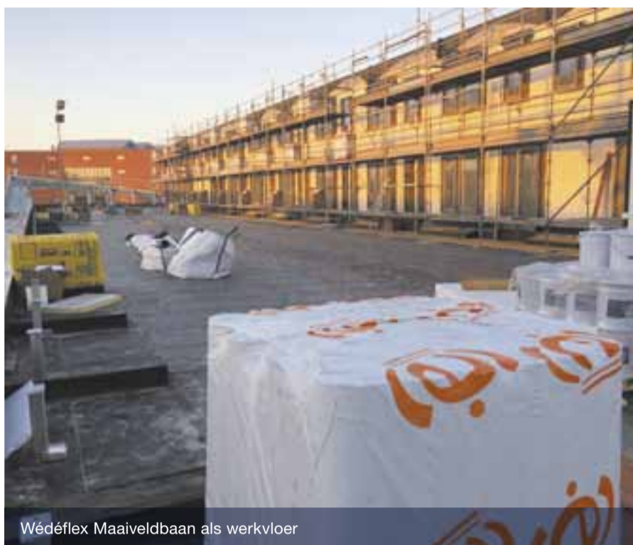
Wédéflex Maaiveldbaan als werkvloer