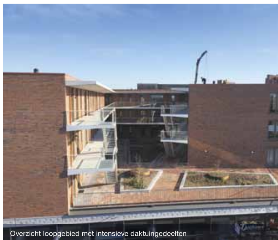
Overzicht loopgebied met intensieve daktuingedeelten