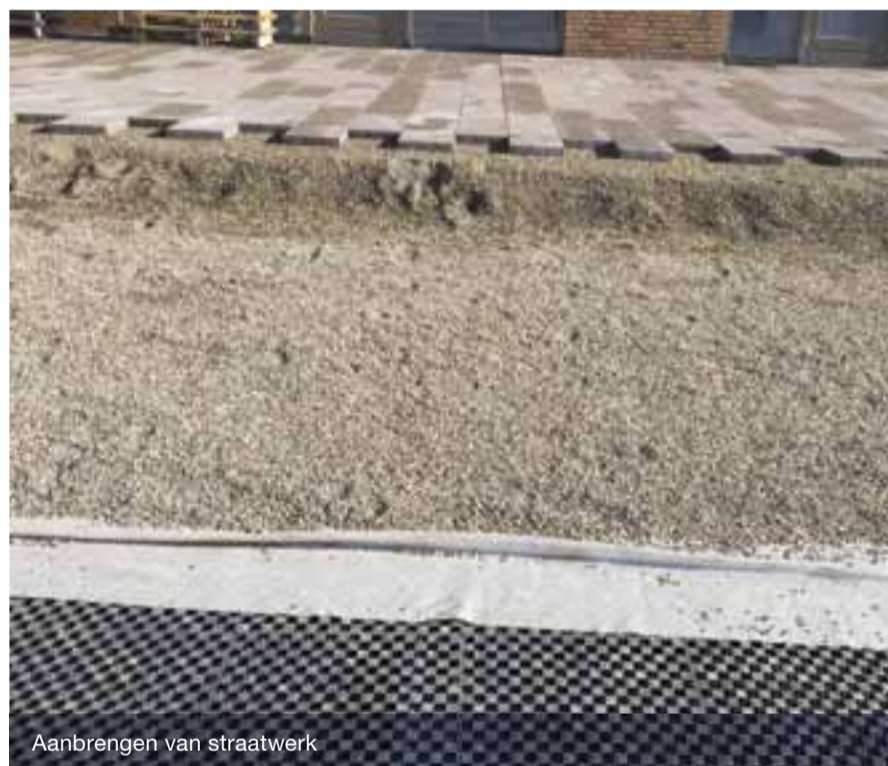
Aanbrengen van straatwerk