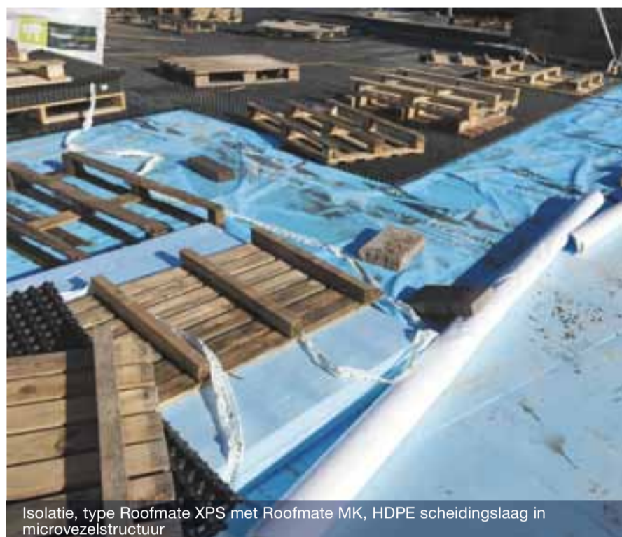
Isolatie, type Roofmate XPS met Roofmate MK, HDPE scheidingslaag in microvezelstructuur