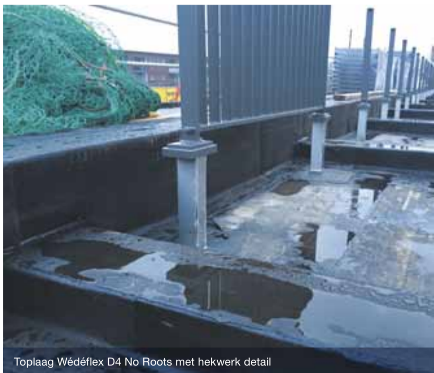
Toplaag Wédéflex D4 No Roots met hekwerk detail